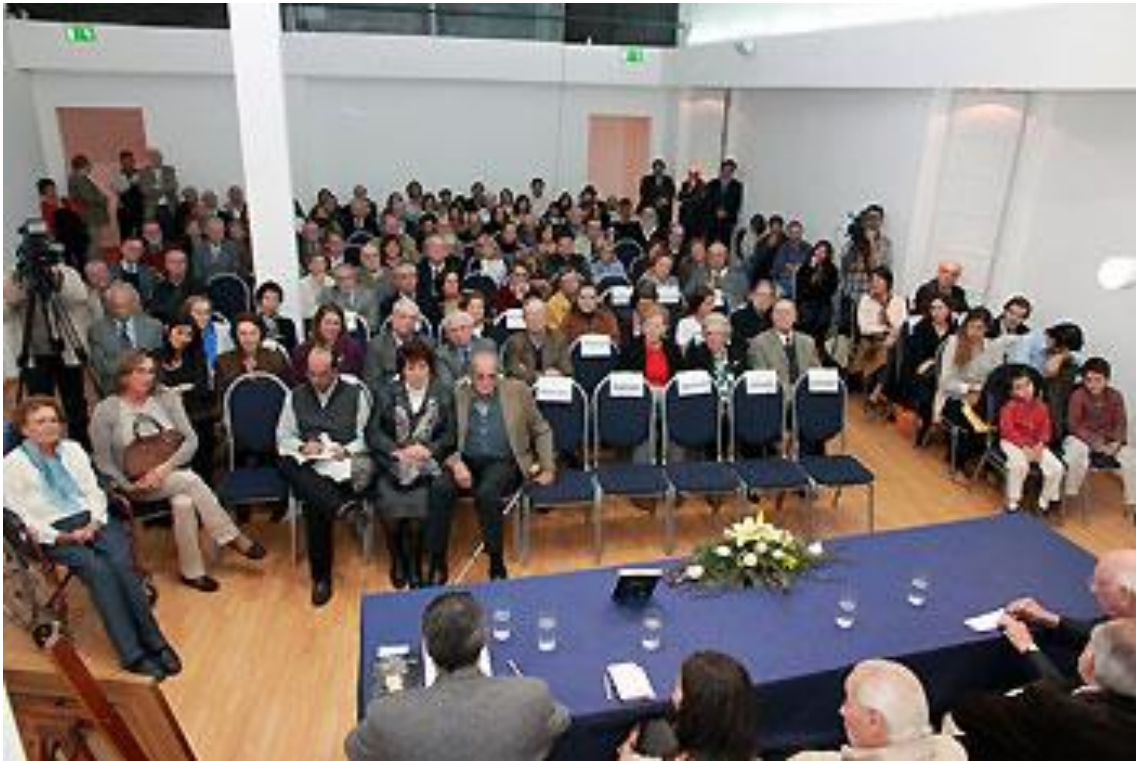
Aspectos parciales del público que acompañó el acto